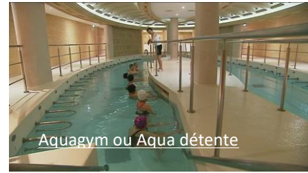
Aquagym ou Aqua détente

Par suite des conséquences du Covid19, l'organisateur peut être contraint de modifier le programme, les horaires et tout ce qui concerne l'organisation de la prestation concernée. Masque obligatoire ! Passe Sanitaire, ou test antigénique ou PCR Obligatoire.