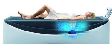
Lit Hydro Massant à Sec