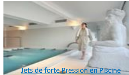
Jets de forte Pression en Piscine